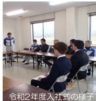
令和2年度入社式の様子